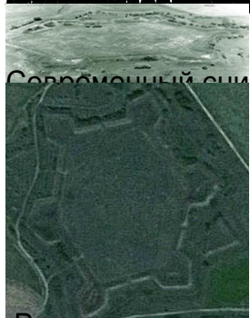
Современный снимок спутника.