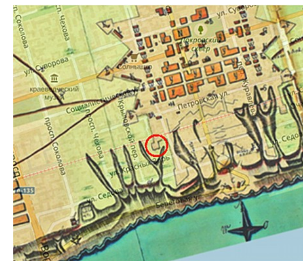
Карта.1. Темерницкий редут на карте Ростова-на-Дону

какие-нибудь отголоски его существования. И мне повезло.