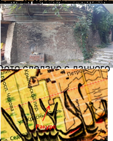
Фото сделано с панорамного ракурса.