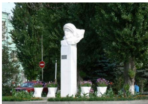
В 1970 году в городе Орехово-Заряе на территории парка имени В.А. Косыгина состоялось открытие памятника первому космонавту Юрию Гагарину.