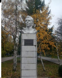
В 1970 году в городе Орехово-Заряе на пересечении улиц Петра Великого и Украинской состоялось открытие памятника первому космонавту Юрию Гагарину.